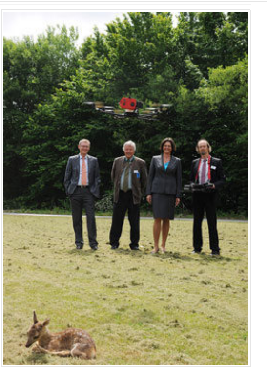
Wildrettungssystem der Zukunft