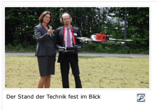
Der Stand der Technik fest im Blick