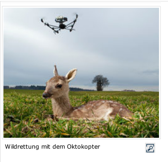
Wildrettung mit dem Oktokopter