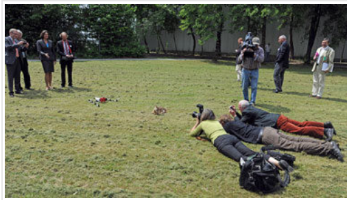
"Bitte hier, Frau Ministerin!"