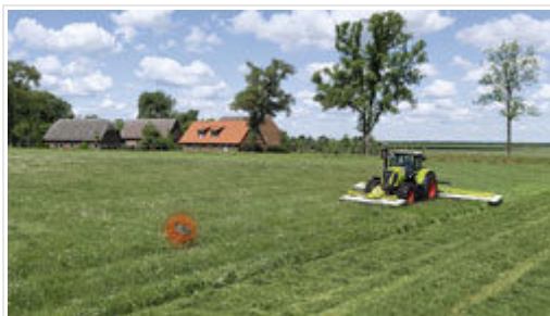
Gefährlich: Bei Bedrohung verharren die Kitze regungslos im Gras